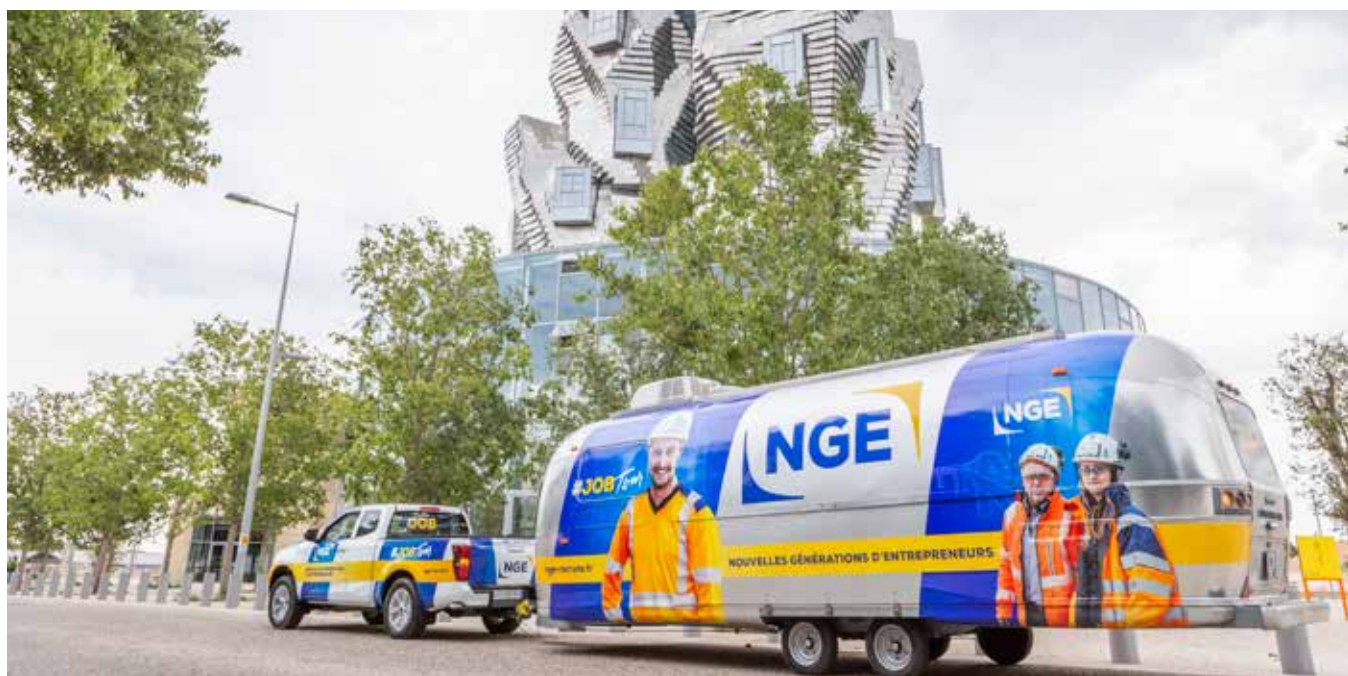
Le jobtour NGE de passage à Arles