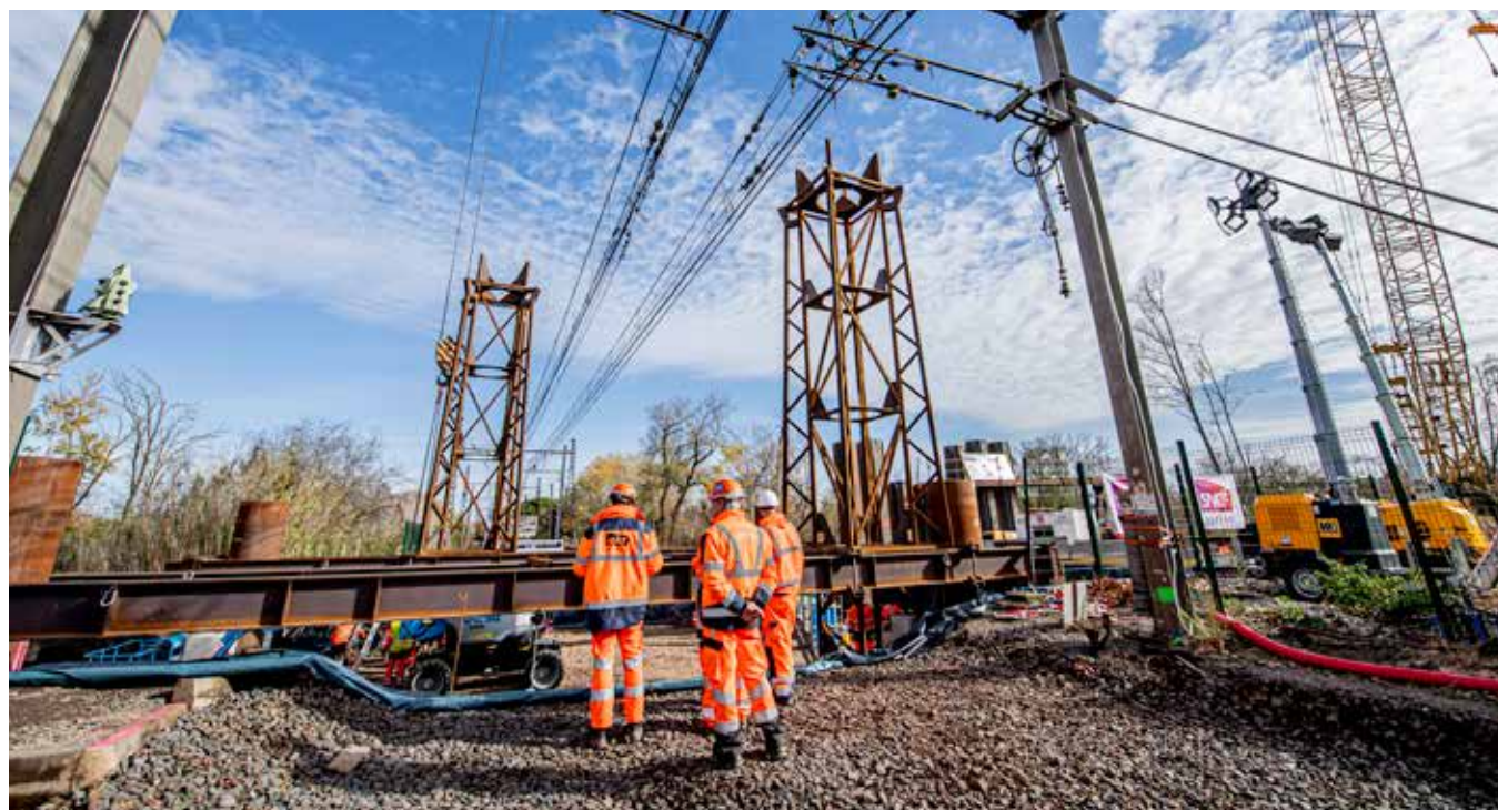
Création d'un passage à niveau dans l'Hérault