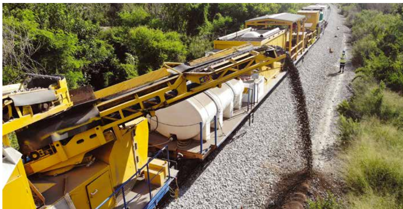
Travaux ferroviaires au Mexique