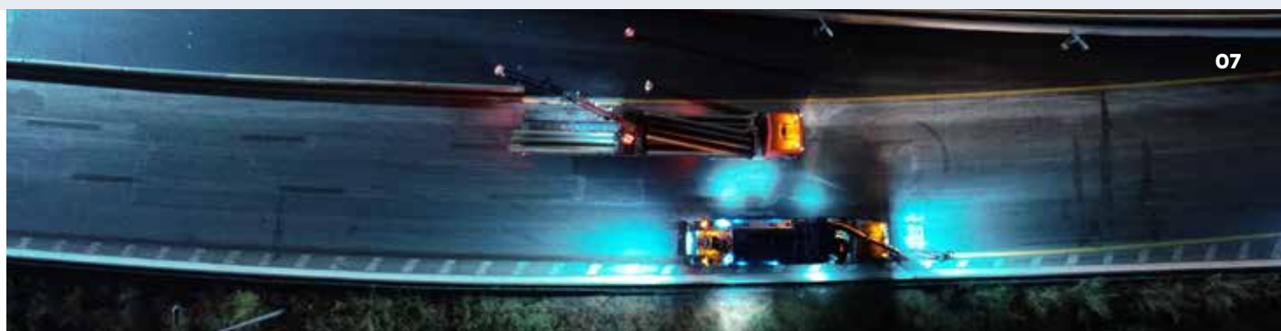
Préparation voie Toulon-Nice - A57