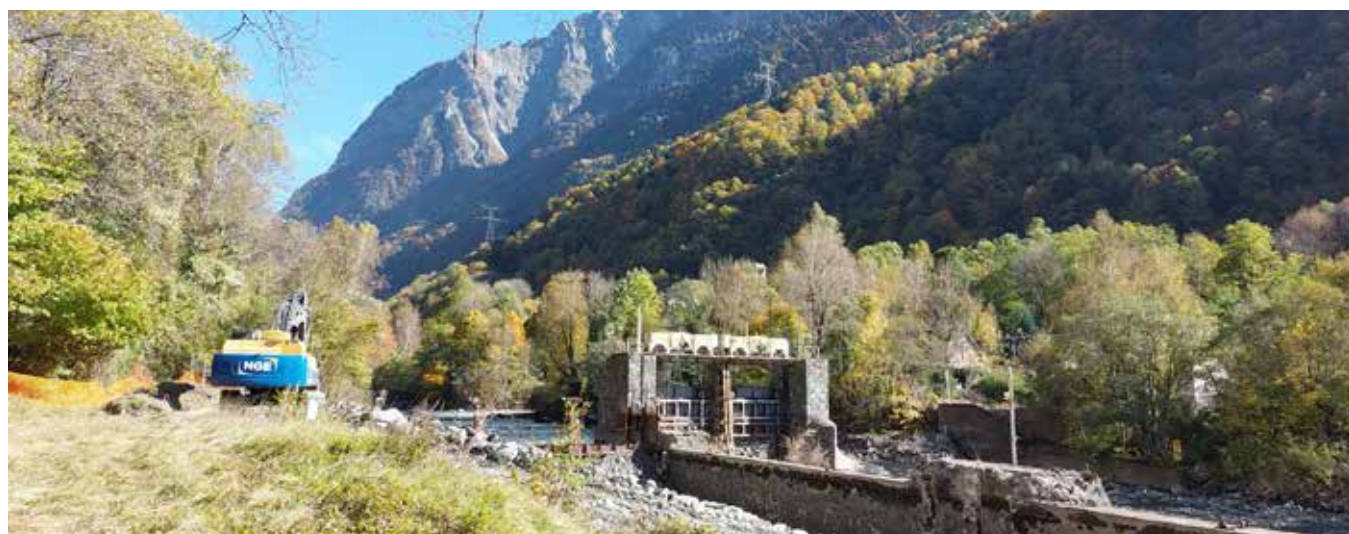
Travaux de renaturation en Moyenne Romanche