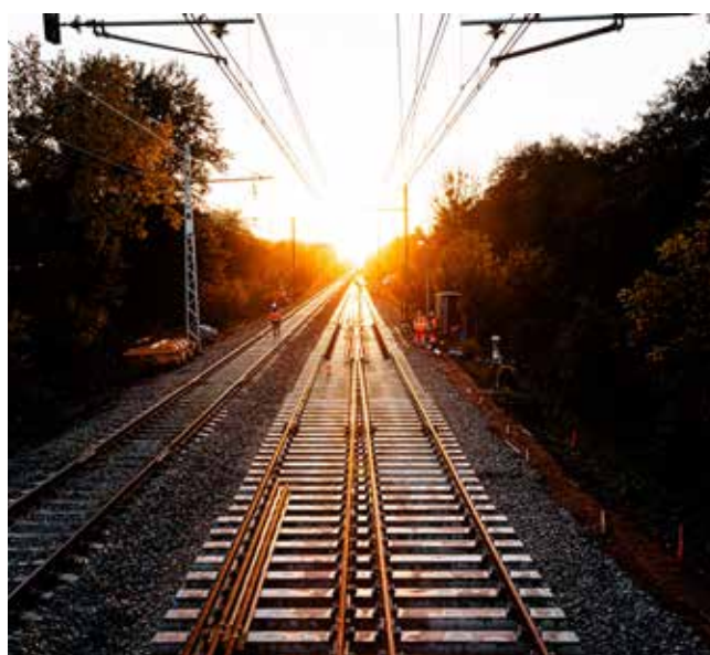
Chantier Vigirail à Connerré

Les provisions courantes correspondent aux provisions directement liées au cycle normal d'exploitation pour la partie à moins d'un an.