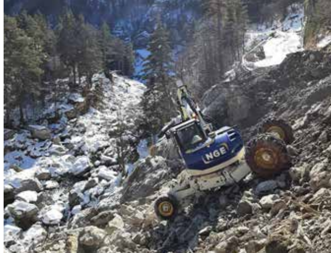
NGE au chevet de la Vallée de la Roya. Ici, la pelle araignée réalise les premiers sondages

Conformément à la norme IFRS 16 « Contrats de location » le groupe évalue la dette relative aux contrats de location sur la base de la valeur actualisée des loyers restant dus au bailleur y compris le cas échéant le prix d'exercice d'une