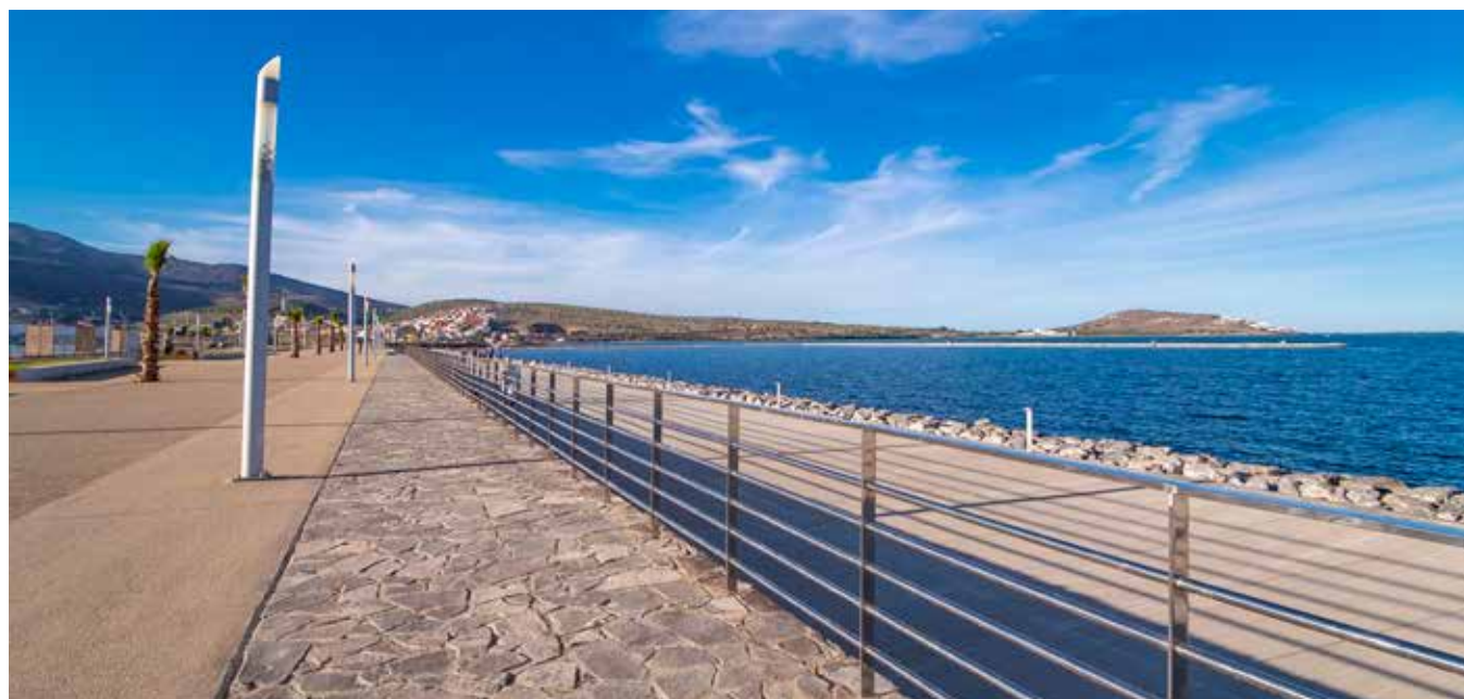
Aménagement corniche au Maroc