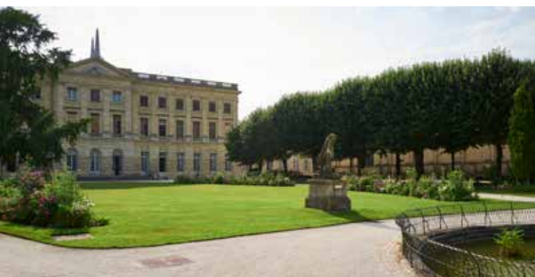
Jardin de la Mairie de Bordeaux