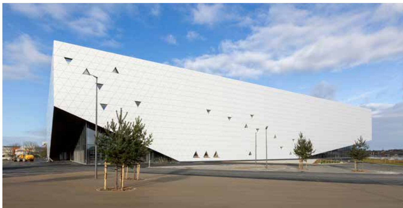
Salle de l'Arena Futuroscope : sport, culture, congrès, concerts...