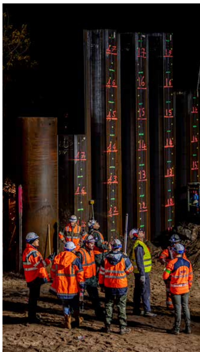
Opération coup de poing sur un passage à niveau à Agde