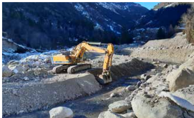
Travaux de renaturation en Moyenne Romanche

Les actifs sur contrat représentent le droit, pour le groupe, d'obtenir une contrepartie en échange de biens ou services fournis au client, quand ce droit dépend d'autres éléments que l'écoulement du temps, il s'agit notamment des factures à établir et des retenues de garanties.