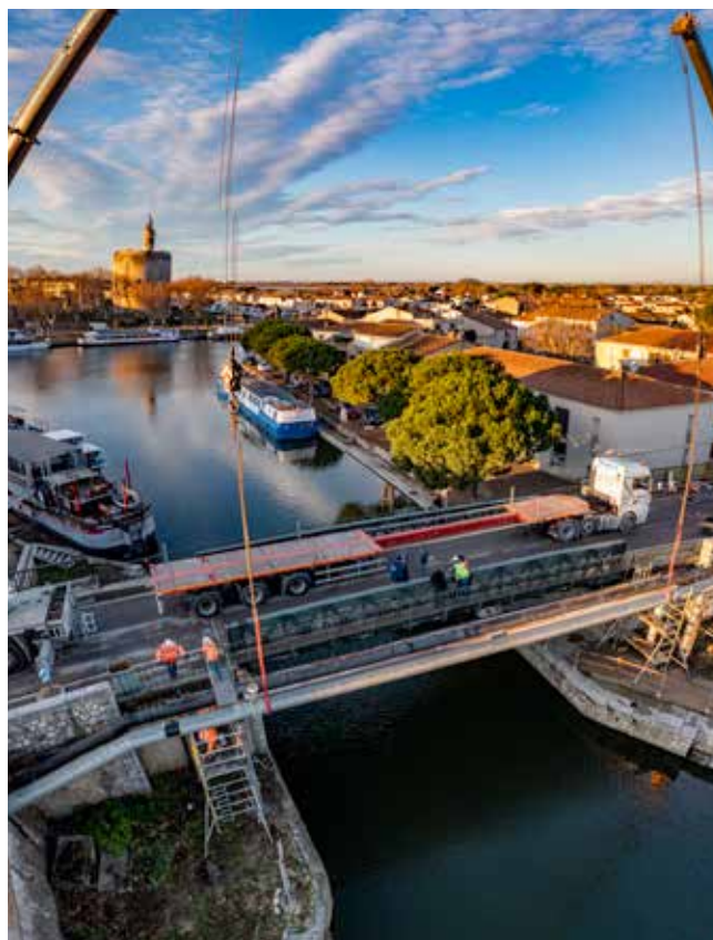
Pont-de-Provence à Aigues-Mortes

Les pertes de valeur résultant des tests de dépréciation des titres mis en équivalence sont comptabilisées en résultat net et en diminution de la valeur comptable des participations correspondantes.