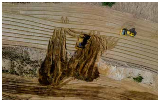
Contournement de Baraqueville par la RN88

Les autres mouvements présentés dans le tableau de variation correspondent à la variation de juste valeur de la catégorie « Actifs financiers, Concessions et PPP ».