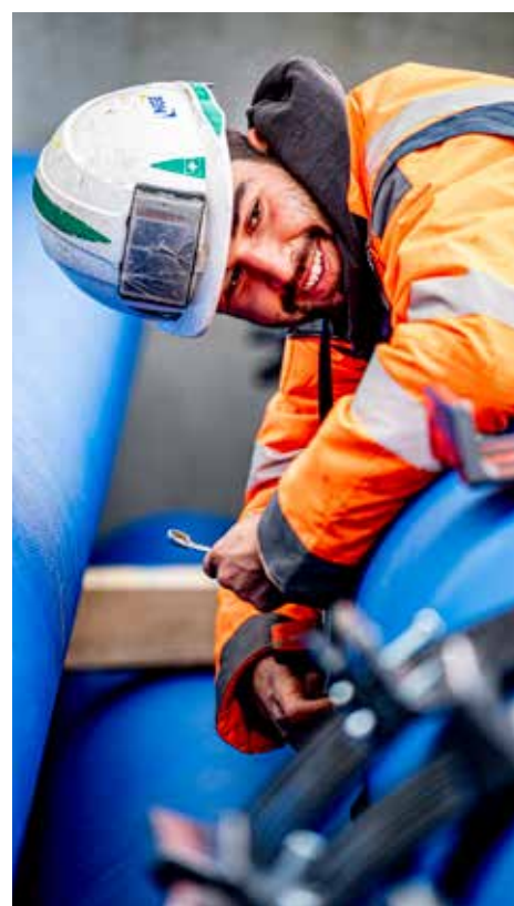
Chantier de canalisations à Vias