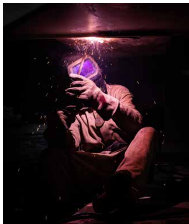
Passerelle de Hazebrouck