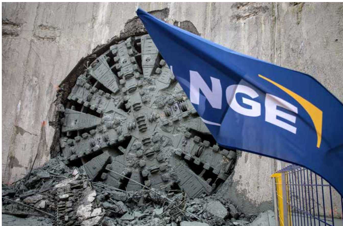
Grand Paris Express - Ligne 16 - Percement du tunnelier Mireille

Il n'existe pas au 31/12/2021 de quote-part des autres éléments de résultat global des entreprises associées et des coentreprises comptabilisées selon la méthode de la mise en équivalence.