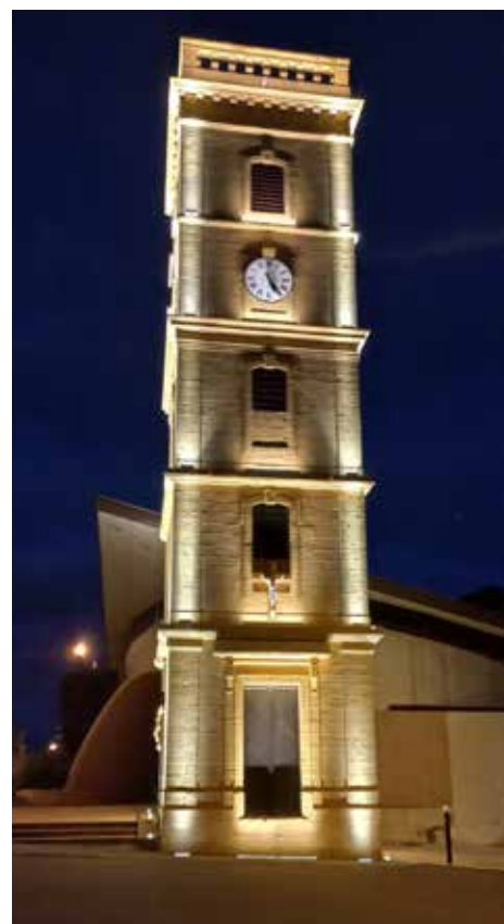
Mise en lumière du clocher de Lexy